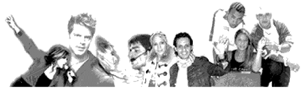
El Vocero de Puerto Rico